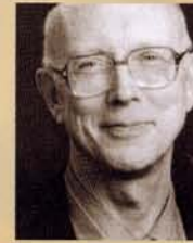
Prof. George M. Whitesides Dpt of Chemistry & Chemical Biology, Harvard University, Cambridge, USA